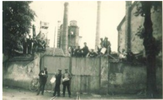
1953 Grève à l'usine à gaz de Belfort

C'est bien à partir de ce travail de collectages, de recherches et de transmissions, c'est bien à partir de la volonté d'agir avec nos collègues actifs, que nous inscrirons le syndicalisme dans des perspectives dynamiques et historiques pour construire un avenir énergétique en lien avec les aspirations de toutes et de tous.