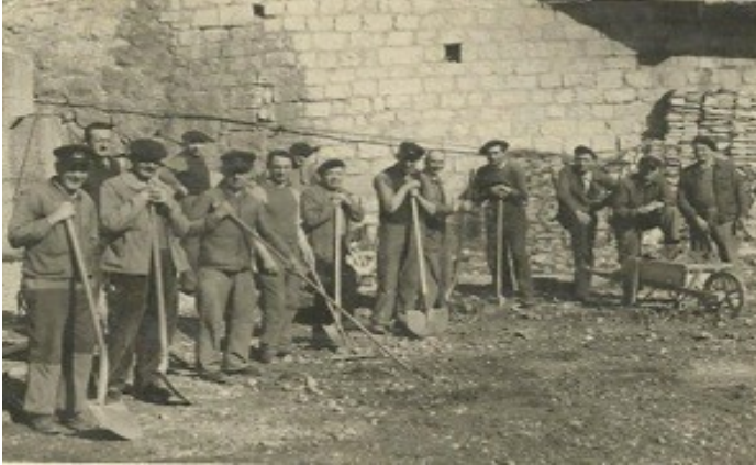
St Claude 1953 Construction d'un terrain de boules lors des grèves

Lors du premier tour des élections présidentielles, bon nombre de candidats se sont pressés aux portails des usines....que de discours et de bon mots à l'égard de ceux qui travaillent, certains n'osant plus prononcer les mots ouvrières, ouvriers....Ils, elles auraient disparu au cours de transformations, d'évolutions, de mutations...et pourtant !!! La désindustrialisation les a gommés du paysage ; le management s'ingénie à les expulser du langage ...et pourtant !!! Peu de traces d'eux sur les écrans de télévision, à la radio, dans les journaux et quand on parle d'eux c'est presque toujours pour évoquer le Front National....et pourtant !!!